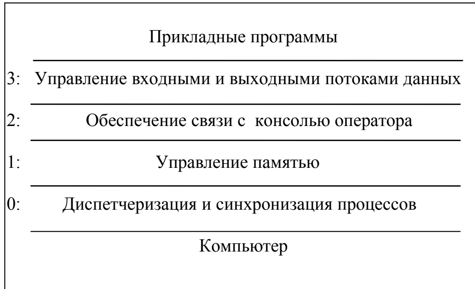
Рис. 6.1. Архитектура операционной системы TNE.

осуществляется управление страничной организацией памяти. Всем вышестоящим слоям предоставляется виртуальная непрерывная (не страничная) память. На втором слое осуществляется связь с консолью (пультом управления) оператора. Только этот слой знает технические характеристики консоли. На третьем слое осуществляется буферизация входных и выходных потоков данных и реализуются так называемые абстрактные каналы ввода и вывода, так что прикладные программы не знают технических характеристик устройств ввода и вывода.